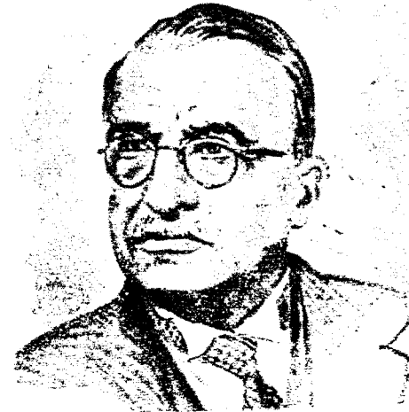
Ο ΣΙΑΔΡΟΥΣ ΚΥΒΕΡΝΗΤΗΣ