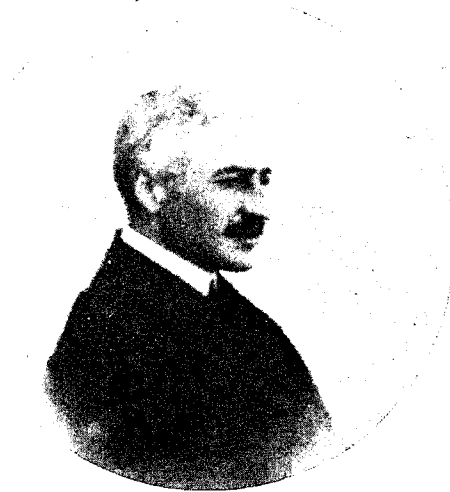
Ο ΙΩΝ ΕΙΣ ΤΗΝ ΚΟΡΣΙΚΗ